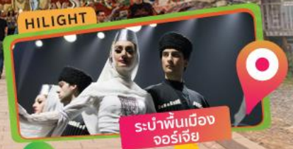
ระบำพื้นเมือง จอร์เจีย